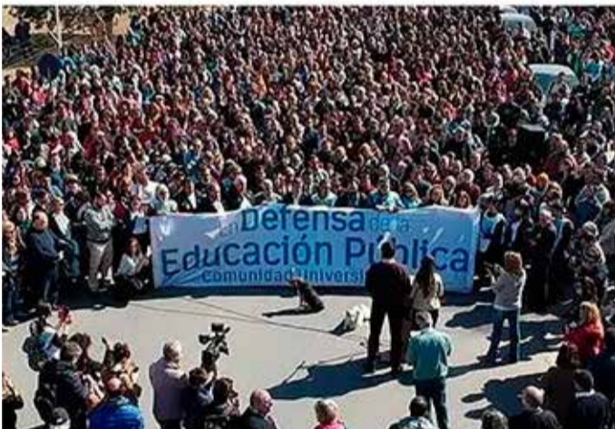
Imagen de archivo.

y convoque a la marcha federal de educación que se realizará el 23 de abril". Dijo: " Es necesario que la UNRC esté a la cabeza de la organización y realización de la marcha por el contexto en que el Estado nacional ha desfinanciado el sistema universitario y los ataques constantes que se replican por los canales oficiales y medios afines ". "La educación pública gratuita y de calidad debe ser considerada un axioma y no una categoría que es discutida y puesta en duda por el presidente de la Nación y sus funcionarios. La lógica del mercado en que todo se compra y se vende no debe imperar en el sistema educativo nacional y provincial ". "Como expresamos en nota del mes de noviembre nuestra universidad debe hacer hincapié en la defensa irrestricta de la democracia como forma de gobierno y sistema social que posibilita