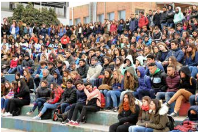
De las Jornadas Universidad de Puertas Abiertas al egreso, un camino de años y trabajo.

Al respecto, otro aspecto a considerar en la gestión de carreras es el reconocimiento de trayectos al interior de los propios planes de estudio cursados por los estudiantes, lo que plantea desde marcos ministeriales como bachilleres universitarios, punto este que también debe atenderse en consonancia con las unidades académicas a los fines de responder a demandas emergentes.